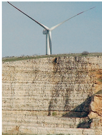
GROTTE Pali sulle grotte

● MINERVINO. Eolico, fotovoltaico ed energie rinnovabili. Prosegue l'azione dell'amministrazione comunale per investire nelle energie rinnovabili. Tra gli ultimi provvedimenti approvati - come si ricorderà - c'è il regolamento sul fotovoltaico, che ha avuto il via libera in una delle ultime sedute del Consiglio. Non solo. Il Comune ha partecipato all'avviso pubblico indetto dal Ministero delle sviluppo economico sulle "energie rinnovabili e risparmio energetico, linee di attività a sostegno della produzione di energia da fonti rinnovabili nell'ambito del rendere efficienti gli edifici e le utenze energetiche pubbliche ad uso pubblico". Nell'ambito del programma